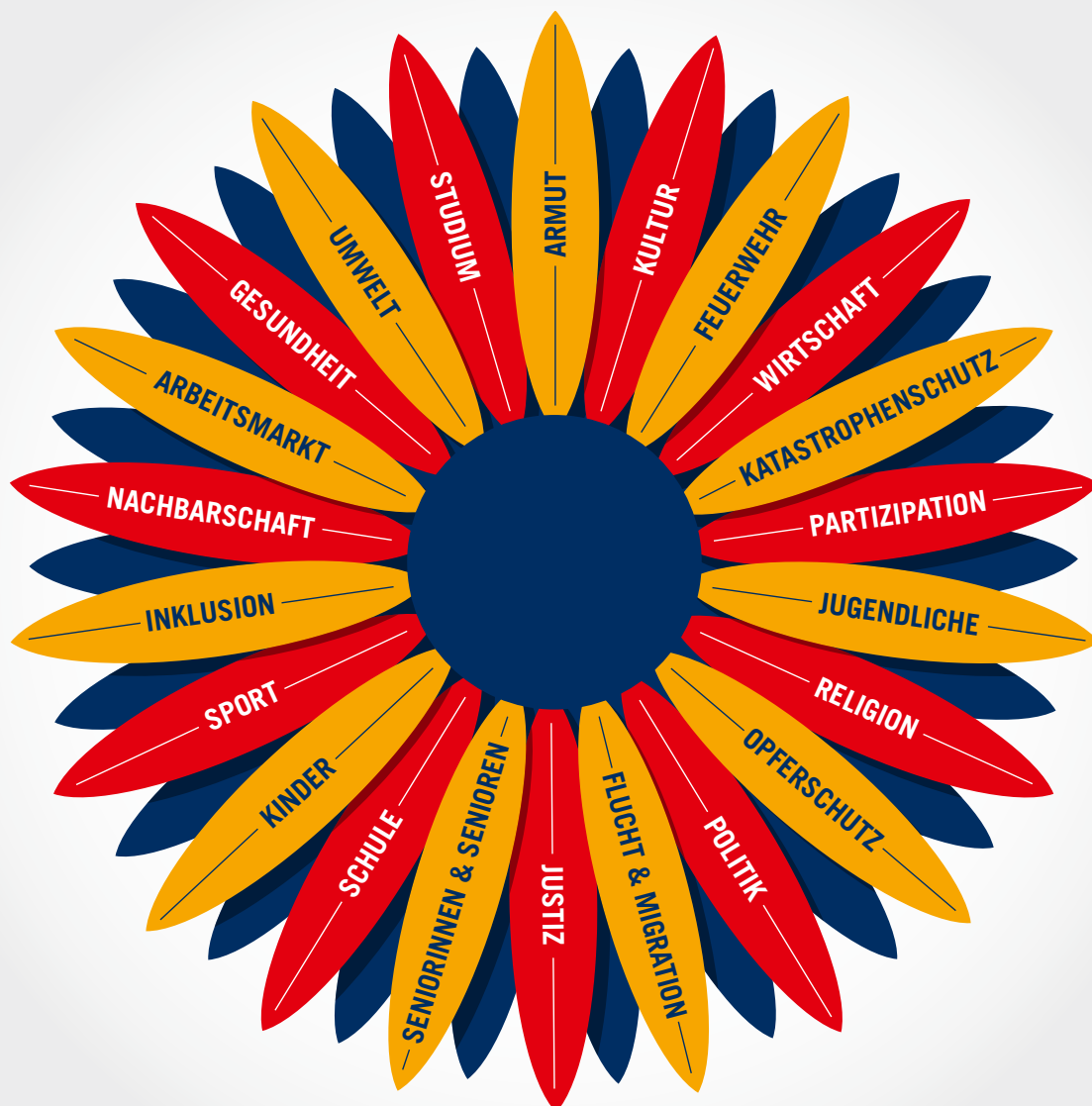
Engagementblume mit unterschiedlichen Engagementfeldern

Freiwilliges Engagement ist vernetzt, multiperspektivisch und interdisziplinär. In seiner breiten Vielfalt lässt sich Engagement nur selten trennscharf auf ein einzelnes Feld begrenzen. Die untenstehende Abbildung versucht diese Zusammenhänge mit dem Bild einer Engagementblume zu verdeutlichen: In den Blütenblättern finden sich die verschiedenen Teilbereiche und Zielgruppen des freiwilligen Engagements, die sehr unterschiedliche Ausprägungen haben, sich aber doch häufig überlagern. Dazu gibt es einen Kern von Motiven, Erwartungen und Bedarfen, der Teilen von oder auch allen Engagementbereichen gemeinsam ist.