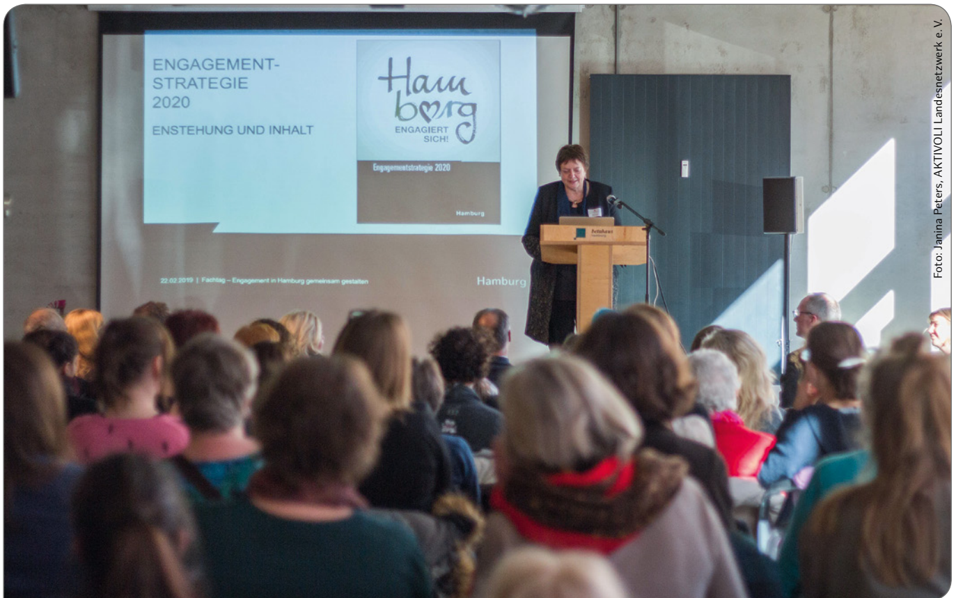
Die Sozialstaatsrätin Petra Lotzkat eröffnet den gesamtstädtischen Fachtag mit dem AKTIVOLI-Landesnetzwerk e.V.

Aufbauend auf den Ergebnissen des Faktages gab es zum Abschluss des Beteiligungsverfahrens drei vertiefende Runden zu besonderen Entwicklungsfeldern des freiwilligen Engagements. Jeweils 15–25 Expertinnen und Experten aus der Praxis trafen sich zu den Themen „Digitalisierung“, „Inklusives Engagement“ sowie „Engagement der Babyboomer-Generation“ und diskutierten die diesbezüglichen Bedarfe, Herausforderungen und Visionen. Auch die Zusammenfassungen der Expertinnen- und Expertenrunden wurden auf der Engagementwebsite der BASFI veröffentlicht.